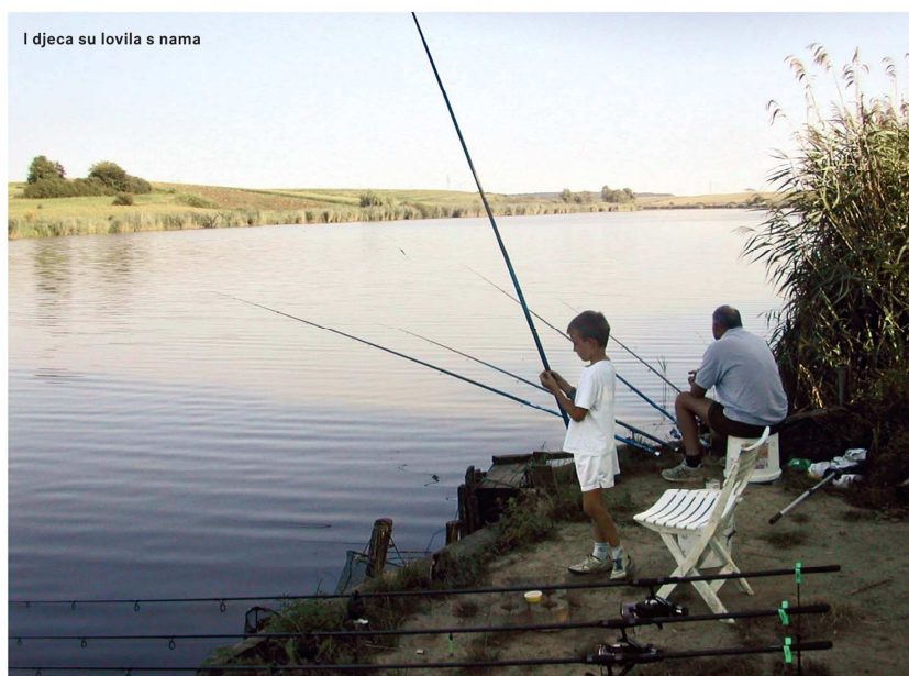
I djeca su lovila s nama