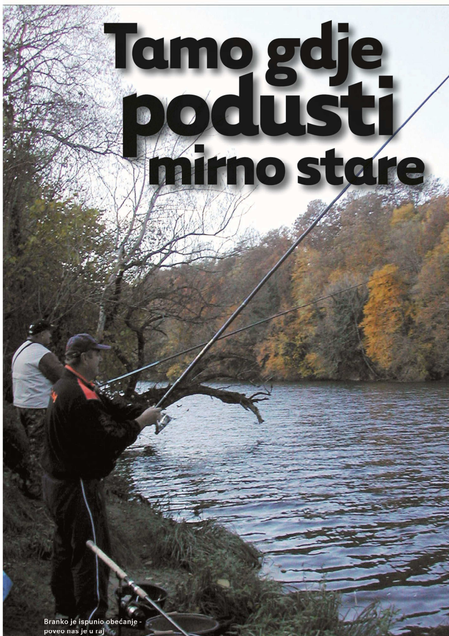
Branko je ispunio obećanje - poveo nas je u raj