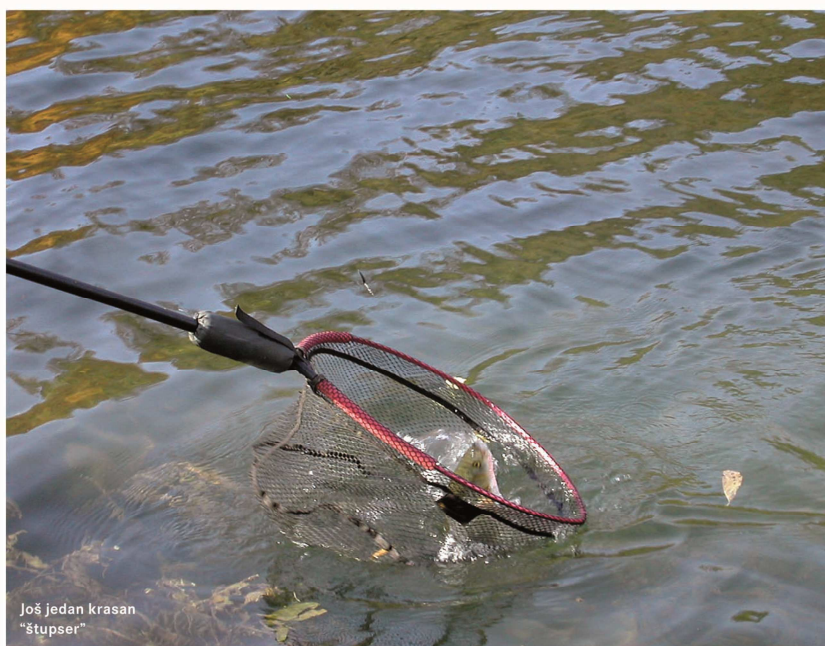
Još jedan krasan "štupser"

lagano privlačenje uz dužno poštivanje ribe i tankog predveza, podmetač i napokon - štupser! I to kakav! Dobro preko kile. Sretni smo jer smo uvjereni da će sada krenuti, ali varka je to, do sljedećeg